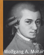
Wolfgang A. Mozart