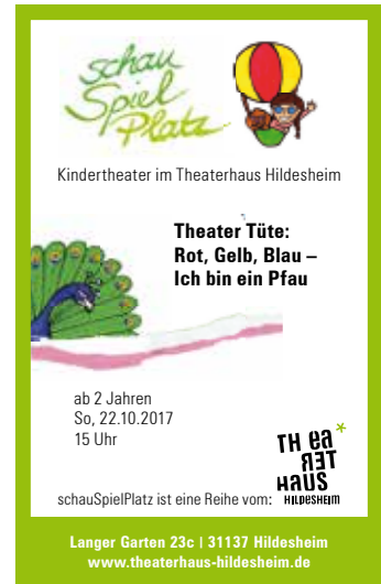
Langer Garten 23c | 31137 Hildesheim www.theaterhaus-hildesheim.de